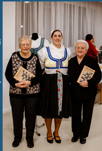
zdroj: Damián Macho

Kniha sa zameriava na obdobie od 1. svetovej vojny až po rok 1958, keď nastalo celoobecné združstevnenie. Venuje sa rozmanitým oblastiam života – či už rodinnému alebo výročnému zvykosloviu. Obsahuje informácie o spôsobe obživy, remeslách, odievaní, detských hrách, bývaní, ale aj o tom, ako naši predkovia slávilí Vianoce, Veľkú noc či ako prebiehala svadba. Venuje sa aj kultúrnym a spoločenským spolkom v obciach a v knihe nájdete aj rôzne povesti, povery, príbehy, detské riekanky či piesne.